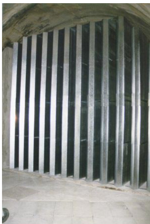
- Ventilation Metro RATP -