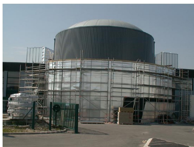
- AéroKart Argenteuil -