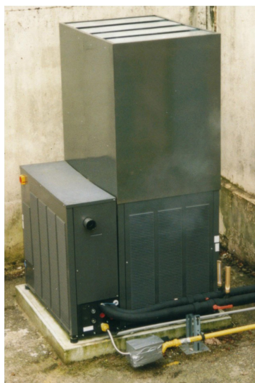
- Silencieux Climgaz -